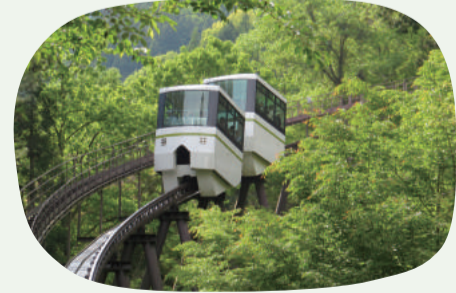
8: ミニモノレール (山崎町)