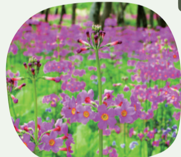
3: ちくき湿原 クリソウ (千種町 見頃:5月中旬-6月中旬)