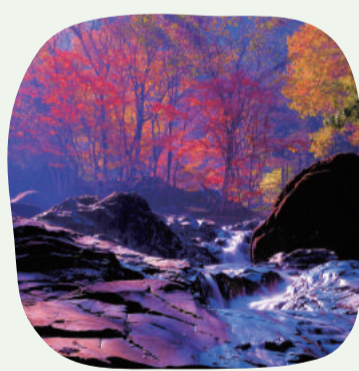
6: 福知渓谷 (一宮町)