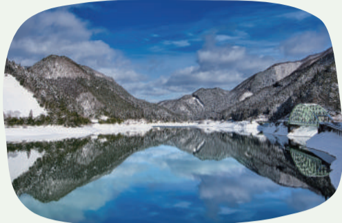
1: 音水湖 (波賀町)