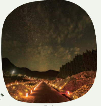
4: やまの里 棚田のあかり (一宮町 開催期間:10月-12月頃)