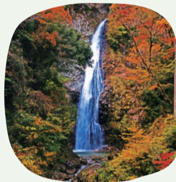
2: 原不動滝 (波賀町)